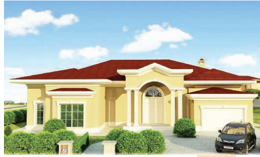
Tip - D