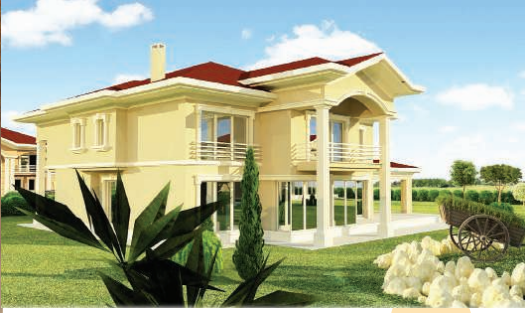
Tip - C