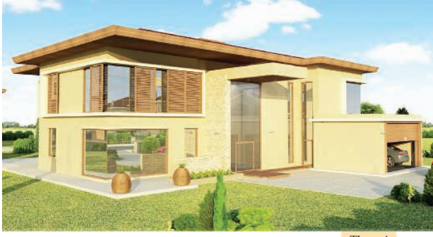
Tip - A