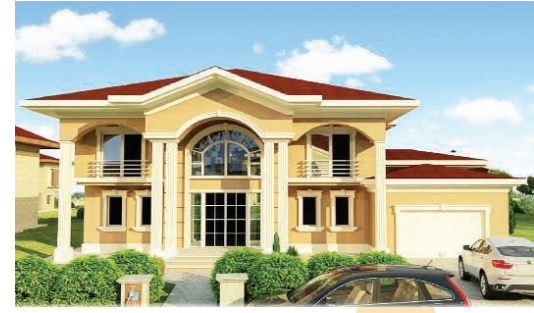
Tip - E