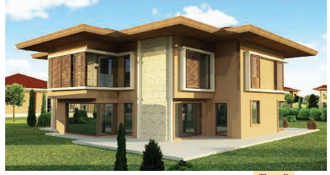
Tip - B