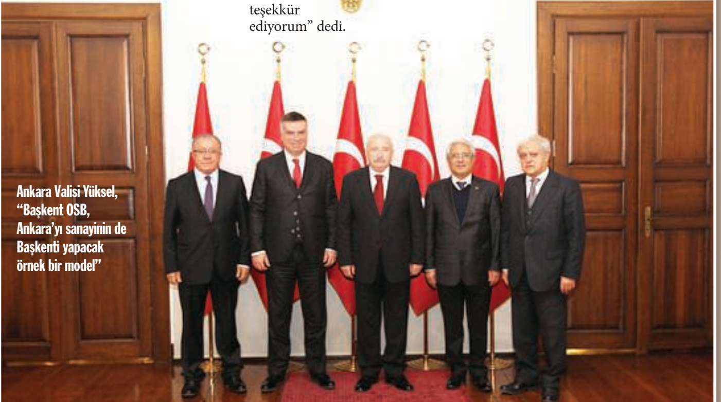
Ankara Valisi Yüksel, "Başkent OSB, Ankara'yı sanayinin de Başkenti yapacak örnek bir model"

Başkent Organize Sanayi Bölgesi Başkanı Şadi Türk ve beraberindeki Heyet, Ankara Valiliği tarihi binasında topluca fotoğraf çektirdiler.