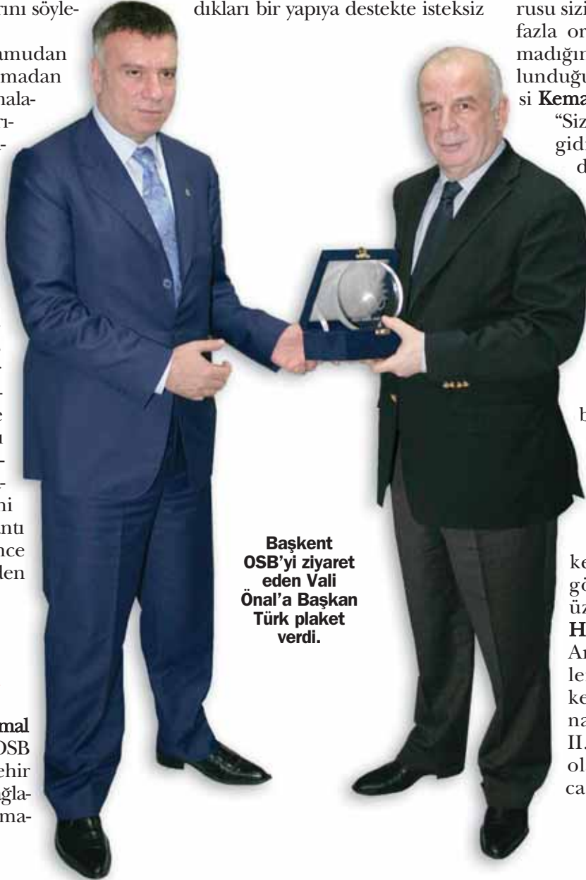
Başkent OSB'yi ziyaret eden Vali Önal'a Başkan Türk plaket verdi.

Bu arada aynı gün Başkent OSB'nin yetkilileri ile görüşmelerde bulunmak üzere bölgede bulunan HAVELSAN yetkilileri de Ankara Valisi Önal 'a verilen brifingde katıldılar. Başkent OSB'nin savunma sanayi üssü olarak planlanan II.Etabında tesisler kuracak olan HAVELSAN ile yapılacak protokol ele alındı.